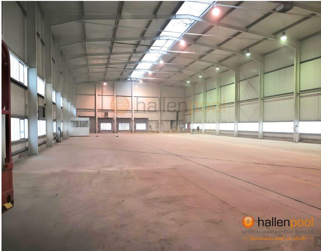
Screenshot 2024-06-13 145726-fotor-202406131573