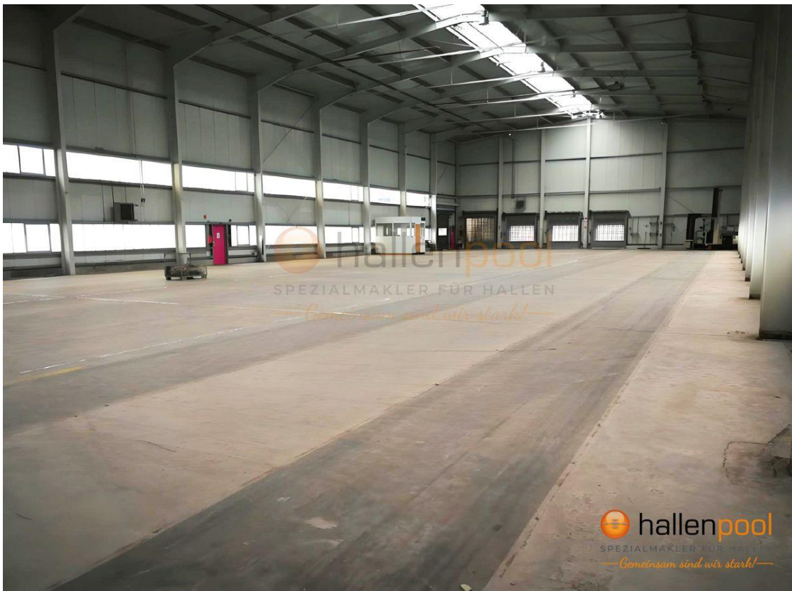
Screenshot 2024-06-13 145731-fotor-2024061315728