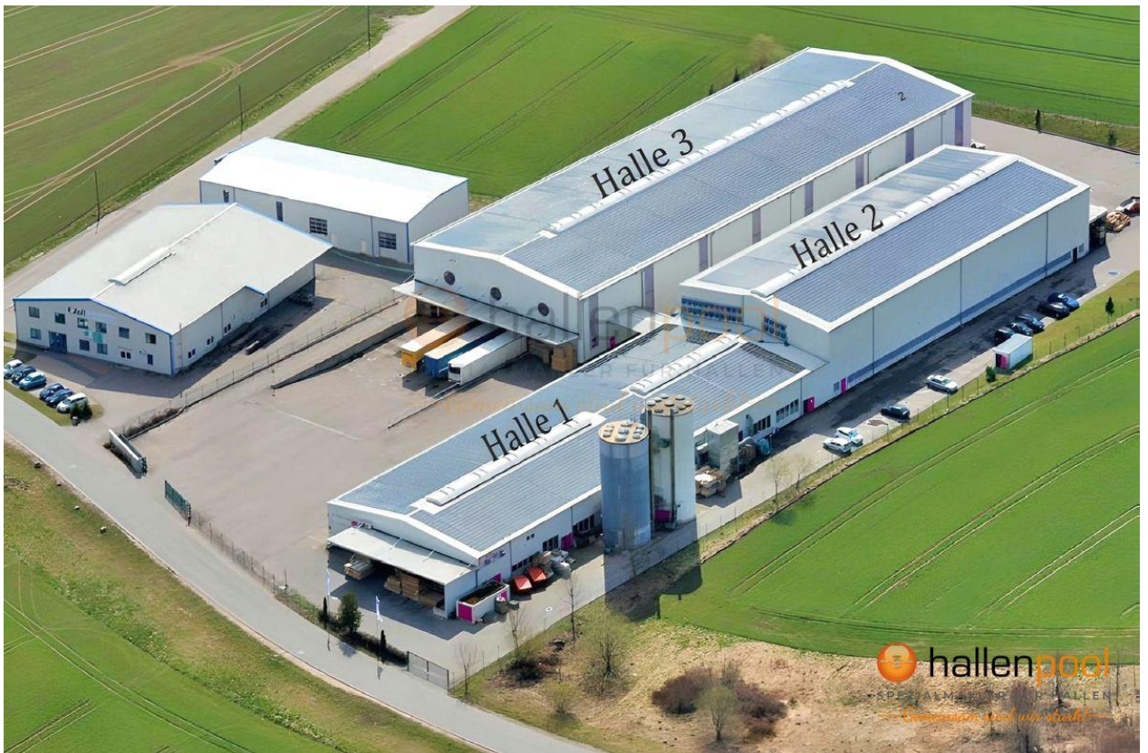
Screenshot 2024-06-13 145655-fotor-2024061315613