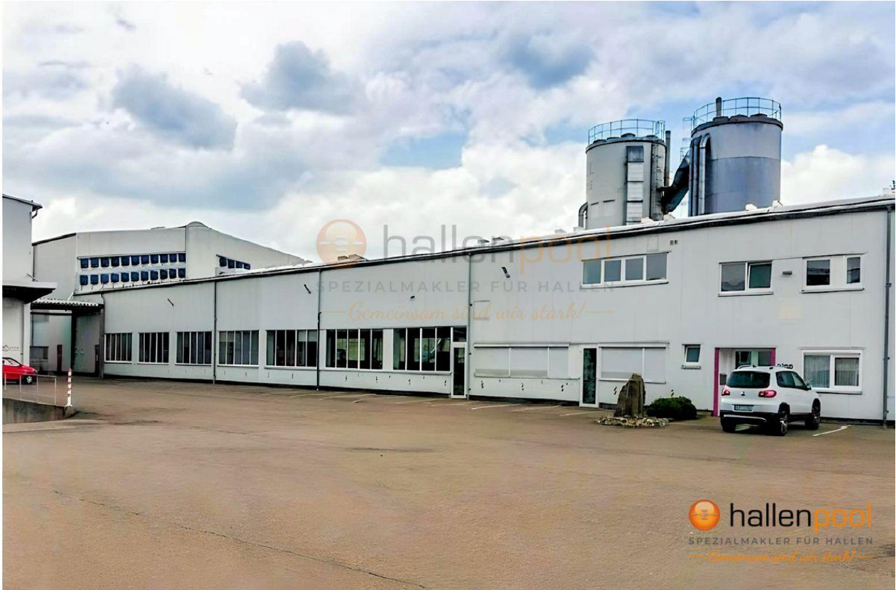
Screenshot 2024-06-13 145715-fotor-2024061315634