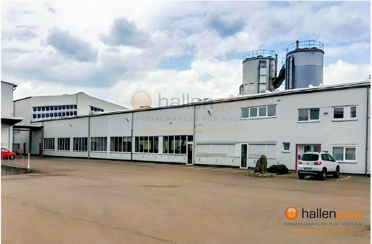
Screenshot 2024-06-13 145715-fotor-2024061315634