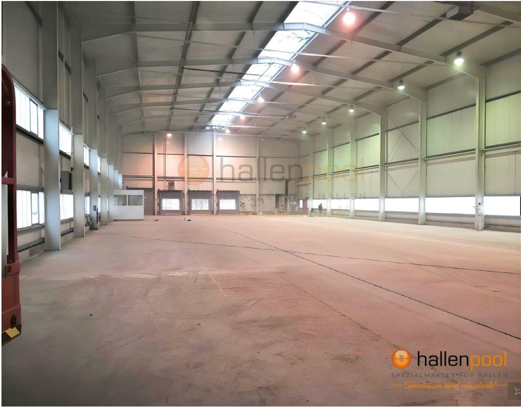
Screenshot 2024-06-13 145726-fotor-202406131573