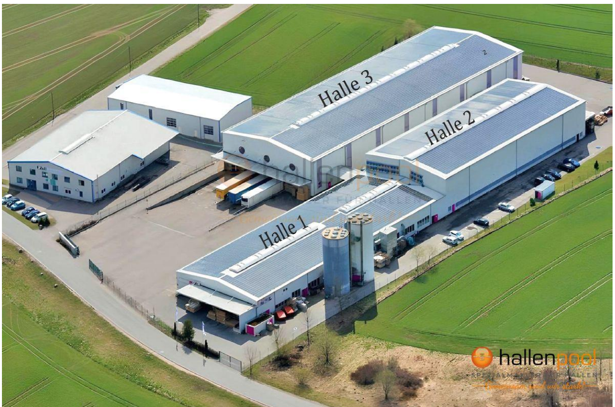
Screenshot 2024-06-13 145655-fotor-2024061315613