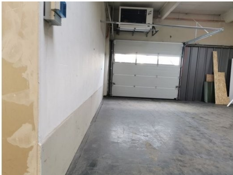
Tor 1 OG