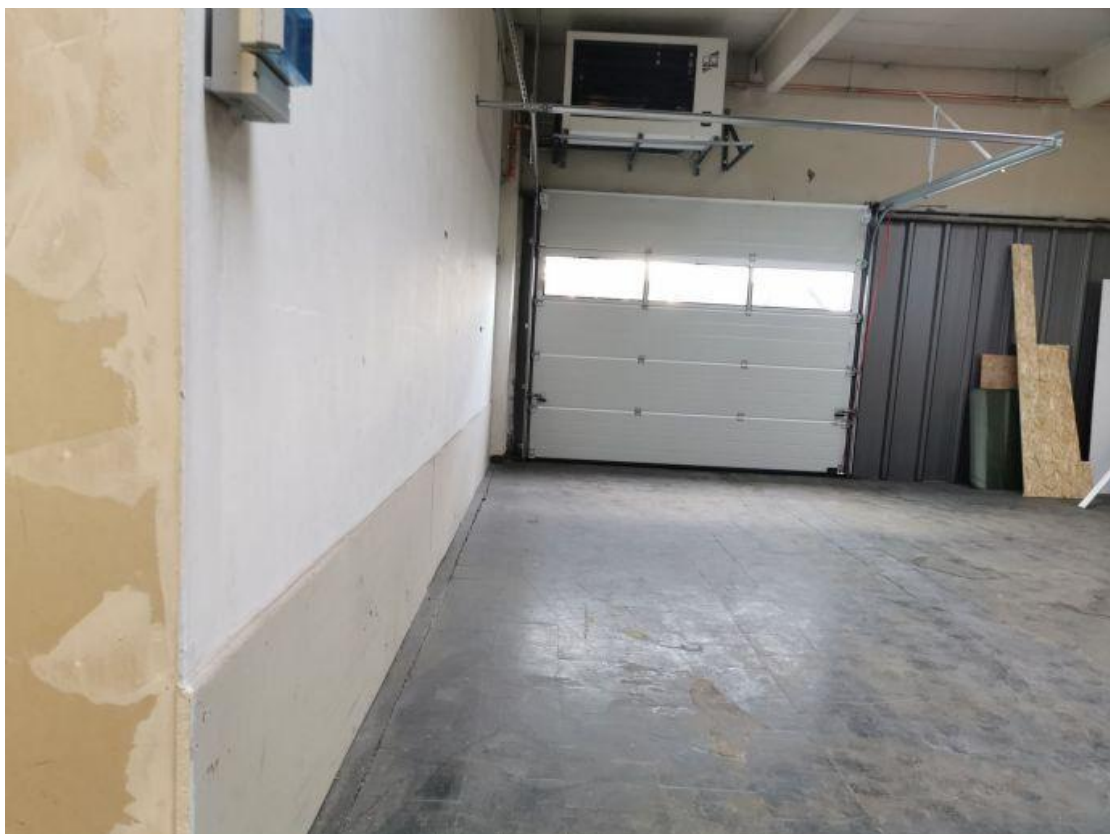
Tor 1 OG