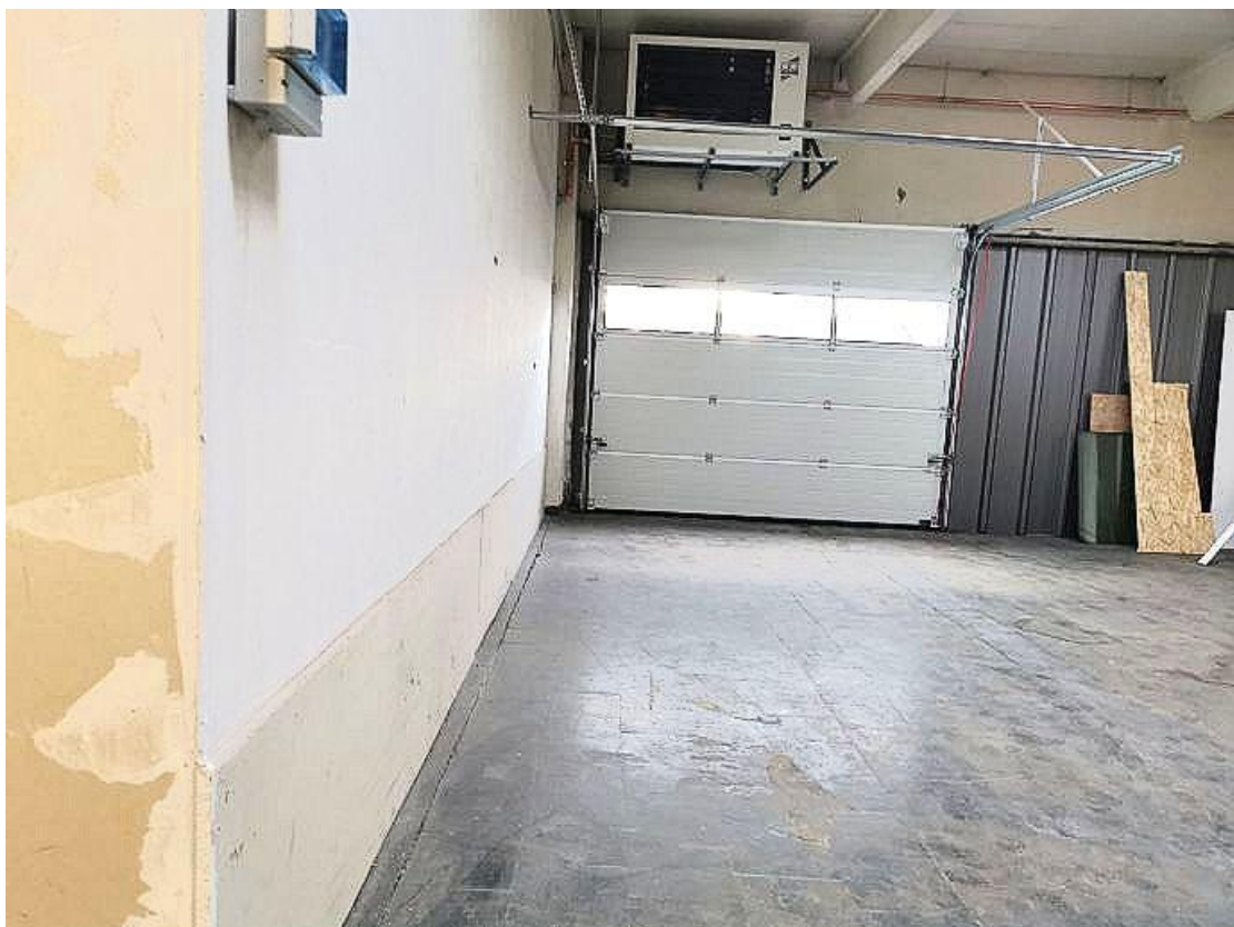
Tor 1 OG